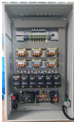
Zentralschaltschrank Central Electricbox